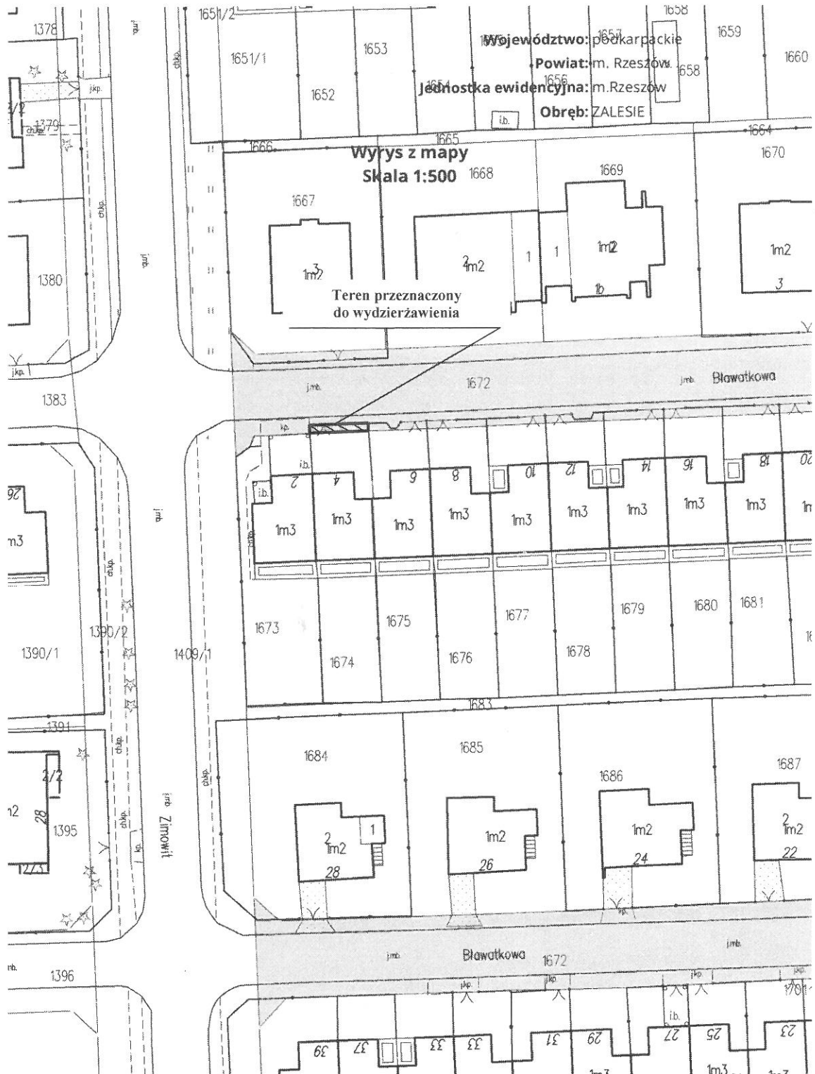
Załącznik nr 1 do uchwały Rady Miasta Rzeszowa Nr LXXIV/1603/2023 Z dnia 31 stycznia 2023 r.